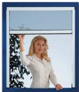
Fensterrollo / Türrollo